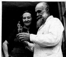
Der Künstler zeigt seiner Gattin, die ihn mit ihrer lebensfrohen Art in seiner Arbeit unterstützt, eine gut gelungene Skizze.